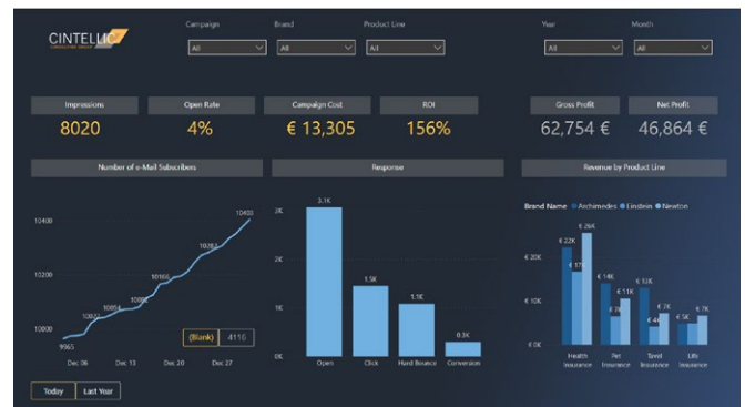
Beispiel E-Mail Response Reporting