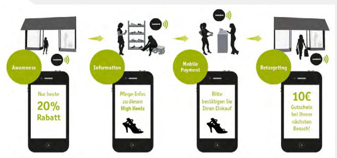
Anwendungsbeispiel für Beacon-Technologie (Grafik: intelliAd Media GmbH)

Mit Hilfe der Beacons wurde der relevanten Kundin zum relevanten Zeitpunkt relevanter Inhalt am relevanten Ort ausgespielt. Darüber hinaus hat die Kundin die Möglichkeit, sich innerhalb der Filiale zu den Super-Sales-Angeboten durch die installierten Beacons navigieren zu lassen. Am Ende entsteht eine Win-Win-Situation: Sabine fühlt sich optimal abgeholt und hat sogar einen Vorteil durch die Angebote im Super-Sale erhalten. Auf der Modehausseite wurde so zusätzlicher Absatz generiert.